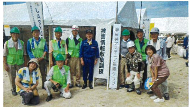
丹羽ひでき衆議委員を囲んで