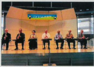
琴古流尺八長月会