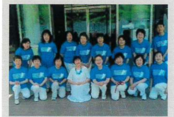
オカリナ スプリング ウェル