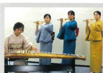
篠笛アンサンブル「藍 音」