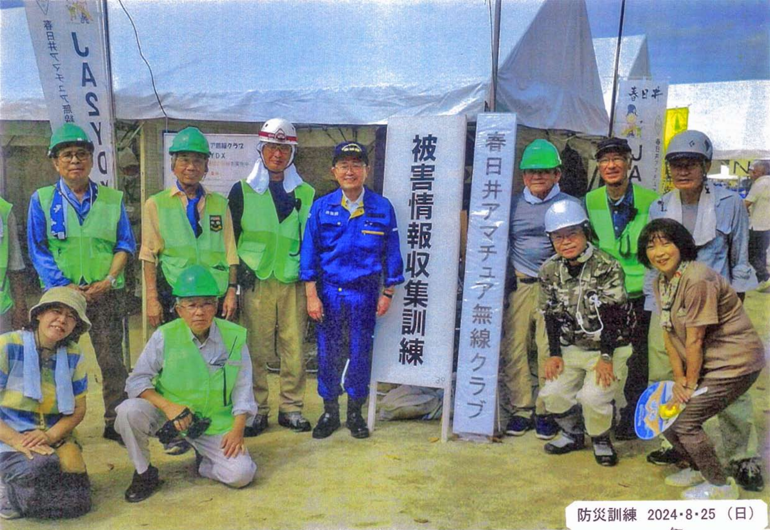
防災訓練 2024・8・25 (日)