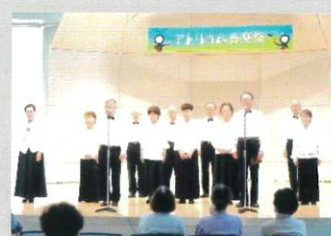
公益社団法人 関西吟詩文化協会 公認 鷺仲吟詠会 東尾張支部