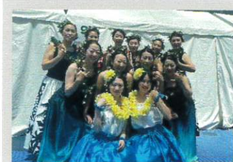
レアレア マカマカ