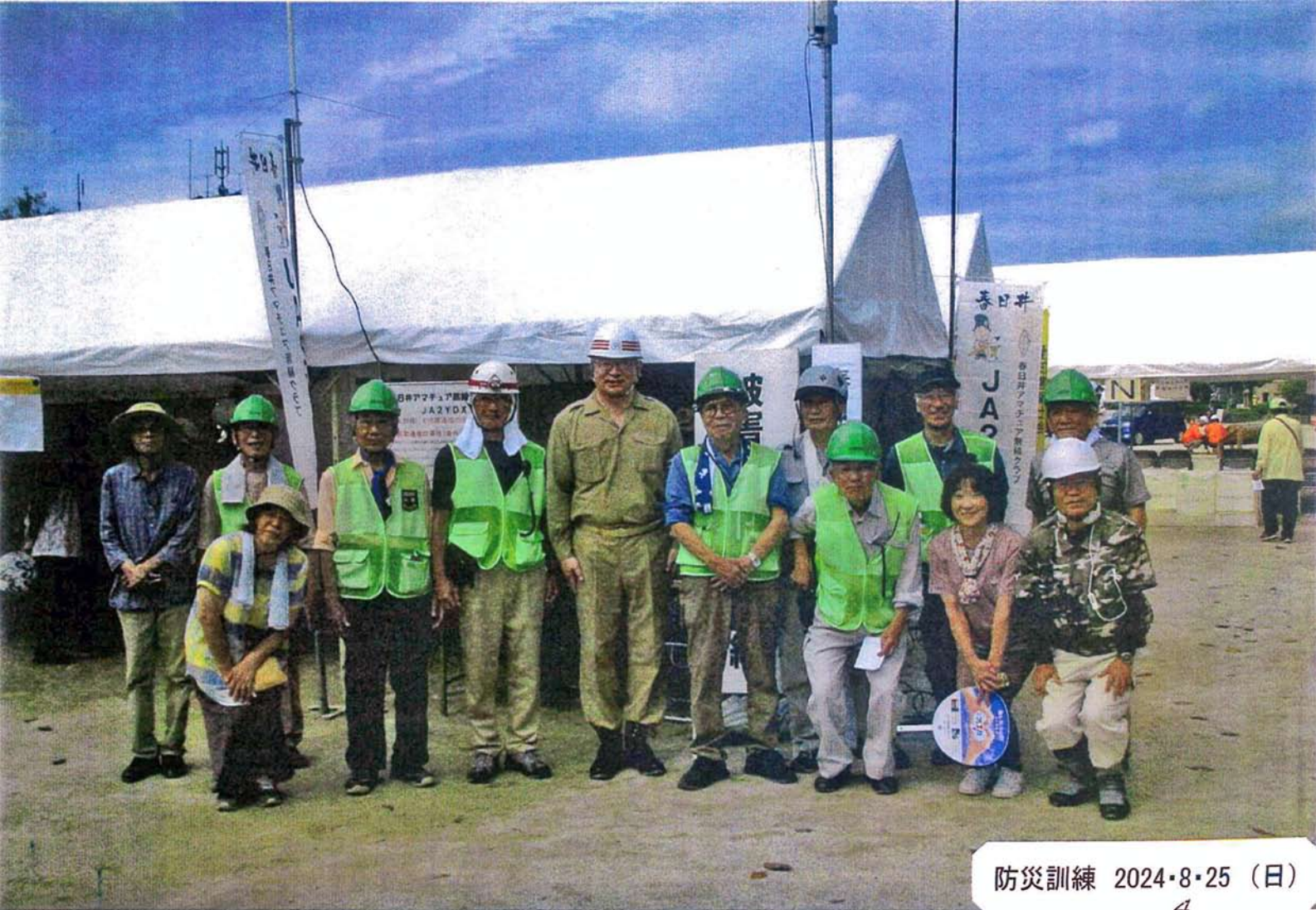
防災訓練 2024・8・25 (日)