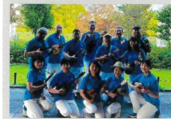
ウクレレユニット・ レインボーガーデン