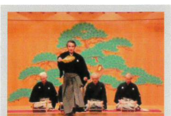
春日井市能楽連盟