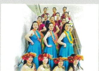
ハーラウ・ワア・ カウラ・ハアリ・マオヒ