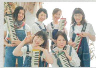
colorful tutti fleur