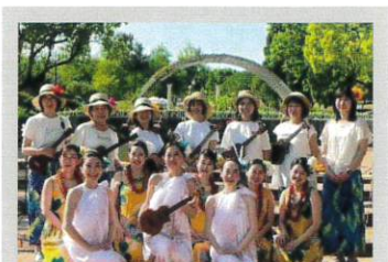
ウクレレピリナ with イミ・オラ