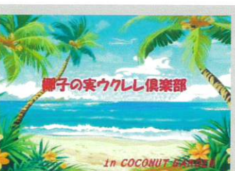
椰子の実ウクレレ倶楽部