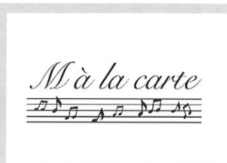
M à la carte