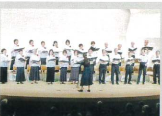
高蔵寺混声合唱団