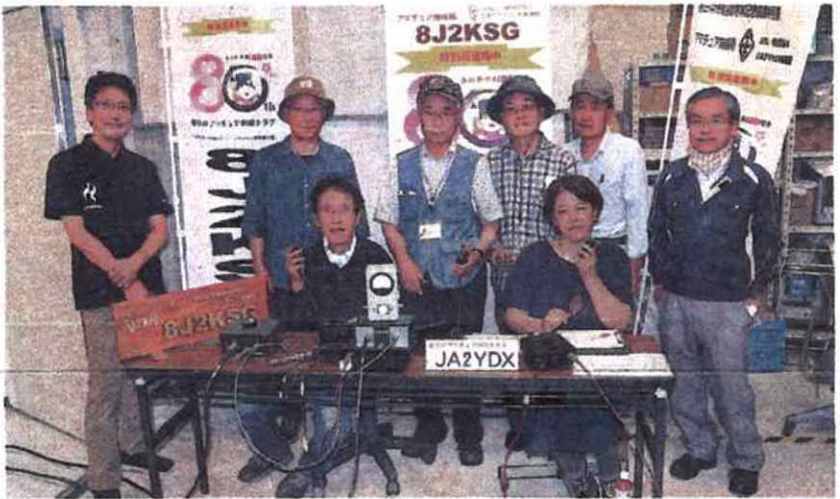
市役所で交信するアマチュア無線愛好家たち