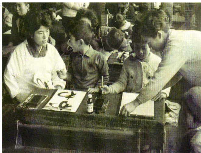
大会前の練習風景